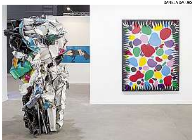
Internacional. Espaço da galeria David Zwirner, baseada em NY e Londres

No terceiro, por exemplo, a gigante Gagosian é separada apenas por uma parede da londrina White Cube — soa irônico que nela, aliás, esteja uma tela de Damien Hirst, artista que recentemente debandou